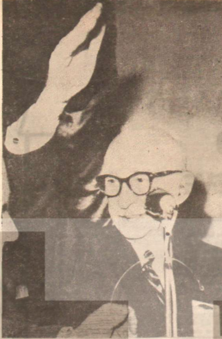
CHP. Genel Başkanı İsmet İnönü Memleketin kaderi...

Kurultay delegelerinin çoğunluğu için de mücadele, iki politika kadar birinin seçilmesi etrafında dönmüyordu. Onlar bakımından anlaşmazlık, statüsü bir süre kavşanı ndan ibaretti. Delegelere, etrafları barıştın, öyle gelin» demiselerdi. Bu yüzden, Kurultayda «Dörtlerin affı» tezî, büyük bir rağbet gördü. Ama İnönü, dayattı. «Dörtler affedilirse, ben