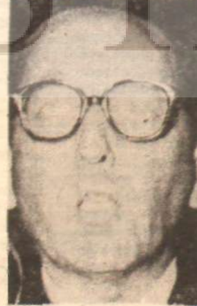
Niyazi Ağırnaslı Senatör