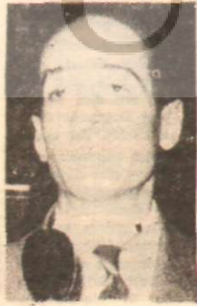
Recal İskenderoğlu Milletvekili