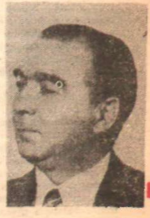
Faki Özen Milletvekili