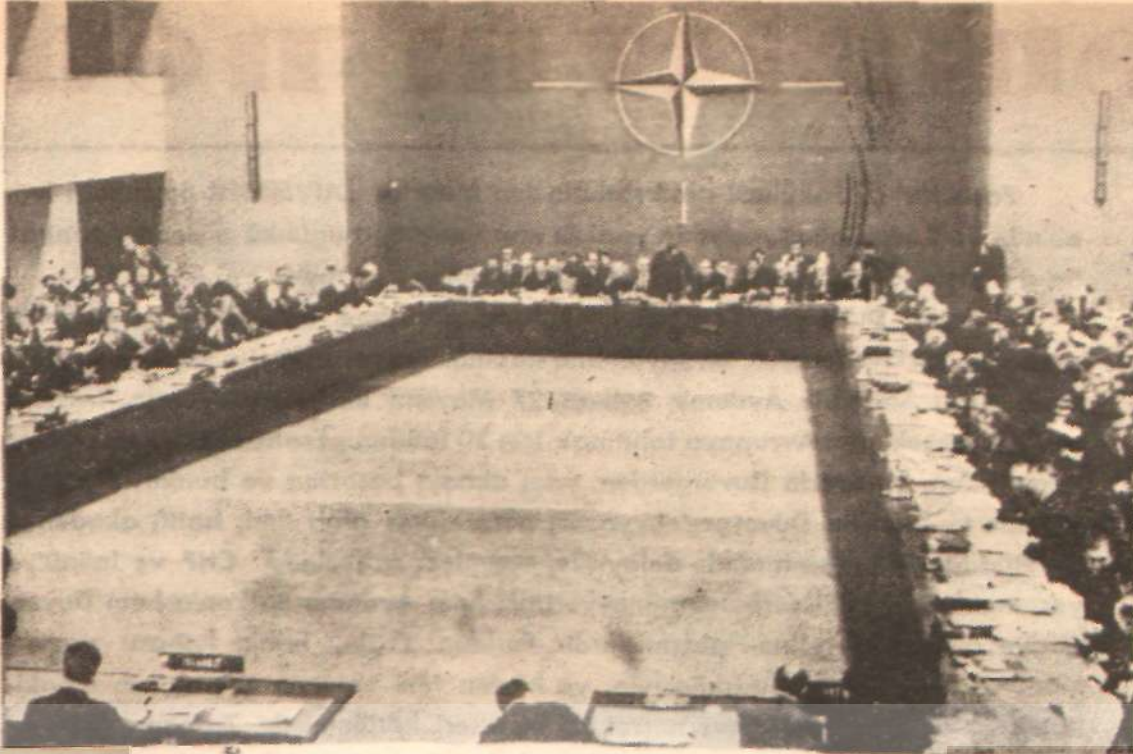
NATO Bakanlar Konseyinin son Paris toplantısı Anlaşma sağlanamadı

Geçen haftanın ortasında Paris'te toplanan Nato Bakanlar Konseyinin üzerinde durduğu