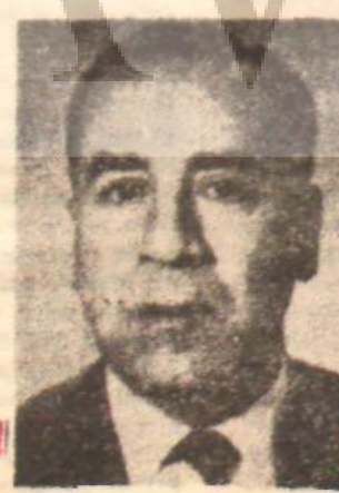
Sırrı Hocaoglu Milletvekili